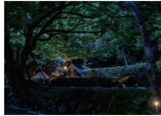
本格的な野営キャンプが楽しめるソロ専用区画「下の棚田サイト」(11区画)