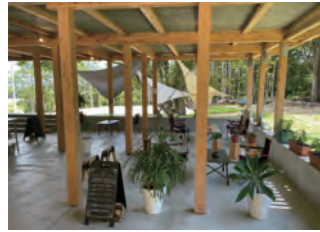
本館1階 ヒロティカカフェ