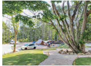
サイト内に車両の横付けが可能。本館に近く利便性が高いライトキャンパー向けサイト。(3区画)