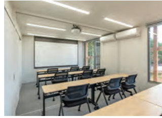
本館2階 会議室 (面積:約20㎡/収容人数:最大12名) スクリーン・プロジェクター完備 ※2室に区切ることも可能