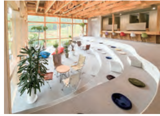
本館2階 棚田ラウンジ (面積:約100㎡/収容人数:最大50名)