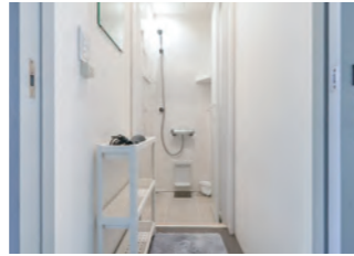
本館1階 シャワー(2室)