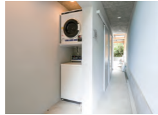
本館1階 コインランドリー