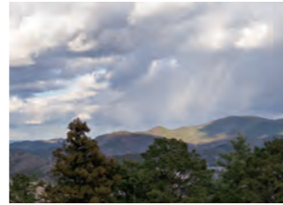
神岳黒岩からの眺望(片道約20分)