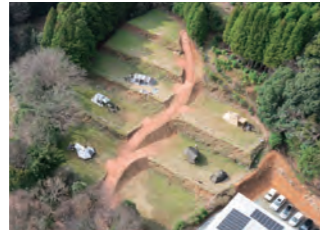
1区画200㎡前後の広大なプライベートキャンプを味わえる「上の棚田サイト」(8区画)